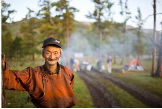
Bildunterschrift 4: Mongolische Reiter dienen als Streckenposten.