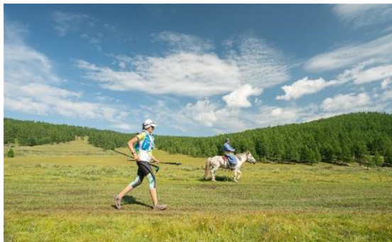
Bildunterschrift 1: Mongolei-Abenteuer: MS2S gilt als einer der schönsten Trail-Läufe der Welt.