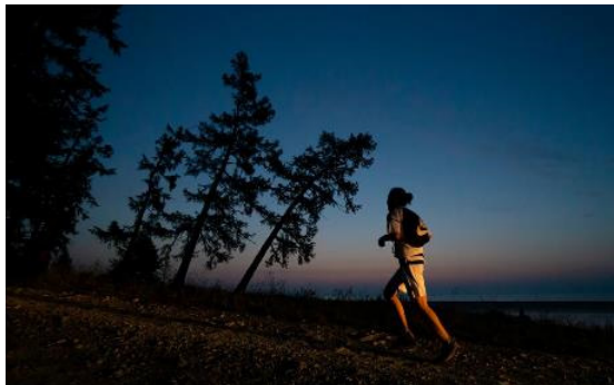
Bildunterschrift 2: Frühmorgendlicher Start am Seeufer.