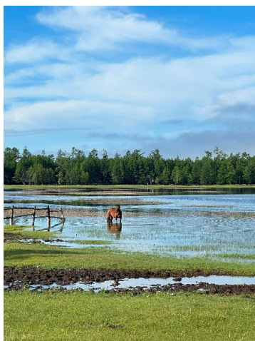
Bildunterschrift 9: Ein Pferd kühlt sich direkt neben dem Toilet Camp ab, wo sich die Start- und Ziellinie des MS2S befindet.

Hochauflösende Fotos zum Download gibt es hier .