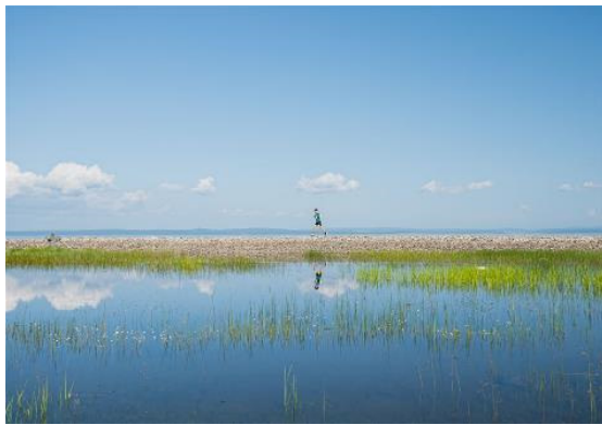
Bildunterschrift 6: Allein auf weiter Flur am Hovsgol See.