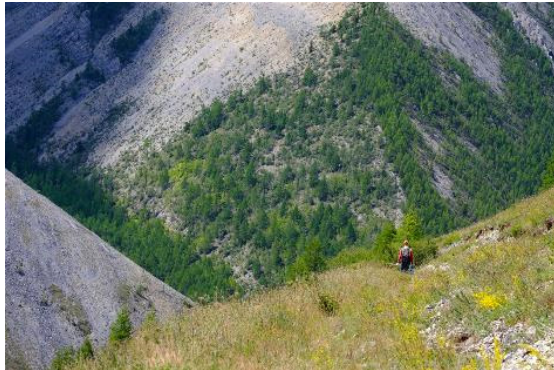
Bildunterschrift 5: Natur pur: Laufen in den Bergen des Hovsgol Nationalparks.