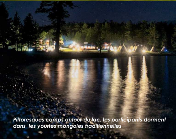
Pittoresques camps autour du lac, les participants dorment dans les yourtes mongoles traditionnelles

Les inscriptions pour la 17 ème édition du « Mongolia Sunrise to Sunset », courses de 42 km et 100 km ultra qui prendront place en août 2015, sont ouvertes !