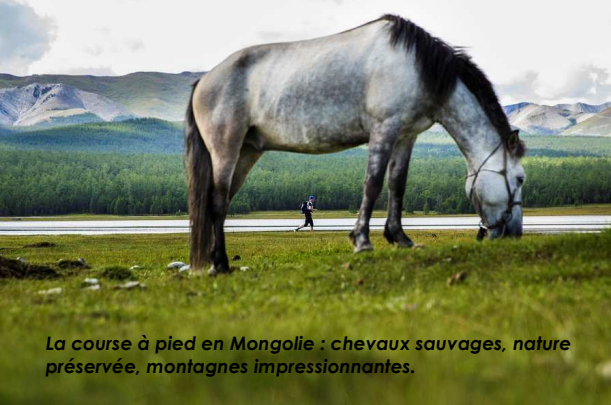
La course à pied en Mongolie : chevaux sauvages, nature préservée, montagnes impressionnantes.