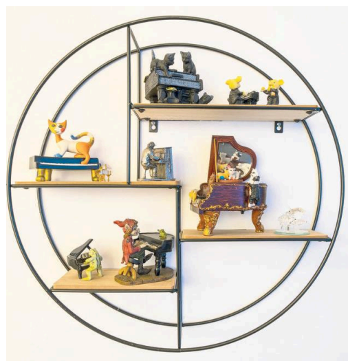
Op bijna elke reis wordt een miniatuurvleugel aangeschaft.