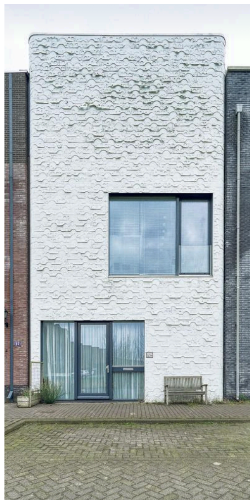
Het 'flapjeshuis', bedekt met gerecyclede fabrieksbanden.