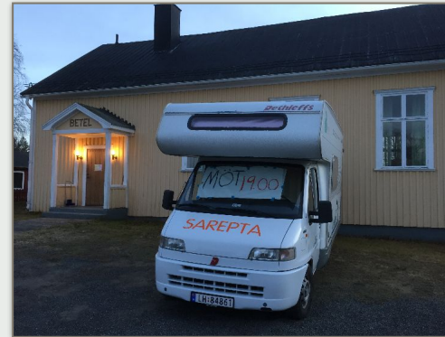
Betel i Sörfors (Nord i Sverige)

Sarepta er opptatt med å skape møteplasser mellom Guds Ord og mennesker. Særlig ønsker vi å besøke steder der det er lite eller ingen sann forkynnelse av Ordet. Vi er ikke veldig opptatt av om det er en eller sytten som møter frem til samlingene. Vi besøker steder over hele Norden. Fra 2020 vil enda flere forkynnere sendes ut med Ordet. Ta gjerne kontakt om du ønsker besøk fra en av forkynnerne som reiser i Ordets tjeneste.