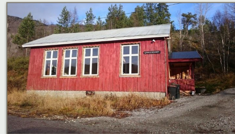
Sarepta hadde møte i Edland på «gamleskolen» høsten 2019