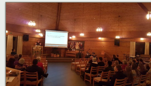
Fra møte i Alta

«Så kommer da troen av forkynnelsen som en hører, og forkynnelsen som en hører kommer ved Kristi ord.» Rom 10,17