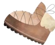
tar på en sko