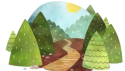
i en skog.