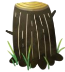
på en stubbe.