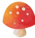
finner en sopp