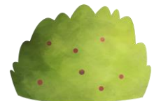
i en busk.