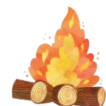
ved et bål.