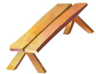
på en benk.