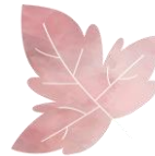
ser et blad