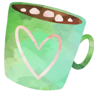
En kop kakao