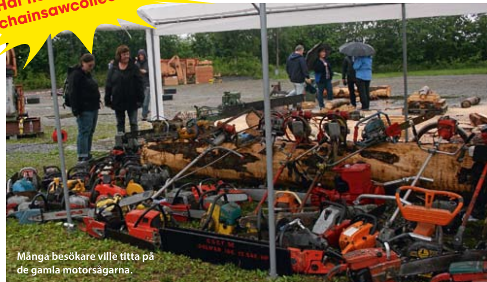
Många besökare ville titta på de gamla motorsågarna.

Här hänger samlarna: chainsawcollectors.se