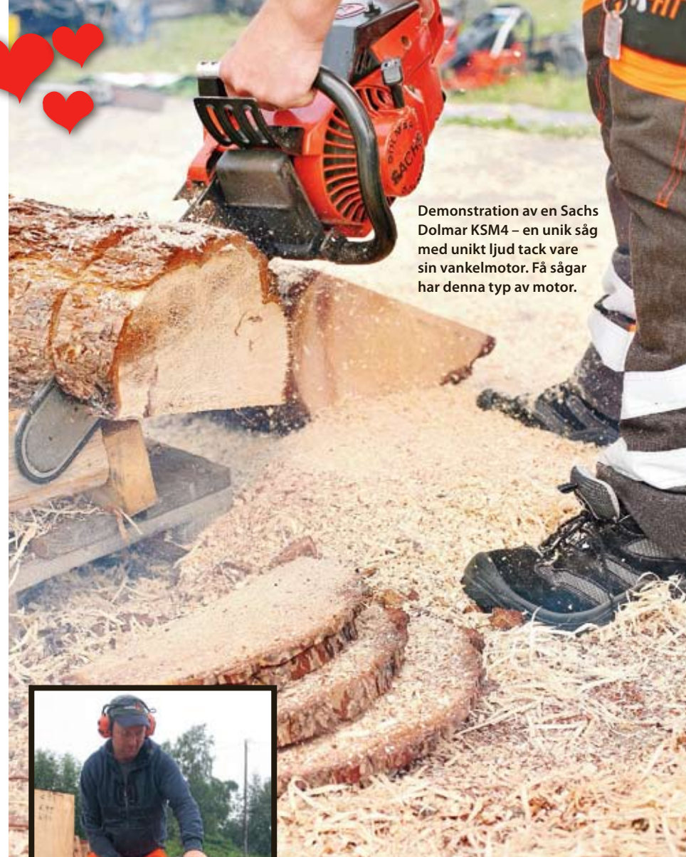
Demonstration av en Sachs Dolmar KSM4 – en unik såg med unikt ljud tack vare sin vankelmotor. Få sågar har denna typ av motor.