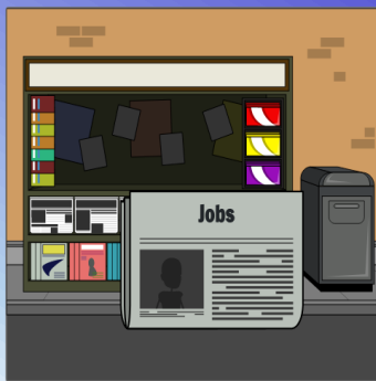
Create your own at Storyboard That

Ihr Unternehmen hat eine Stelle ausgeschrieben und 50 BewerberInnen haben sich beworben. Der gesamte Bewerbungsprozess findet anonym in Ihrem Unternehmen statt. 10 BewerberInnen wurden zum Vorstellungsgespräch eingeladen, die alle gleich gute Qualifikationen haben. Sie sind Personalchef und fordern sich selbst heraus, indem Sie sich während des Vorstellungsgesprächs die Augen verbinden, um sich nicht von Äußerlichkeiten beeinflussen zu lassen