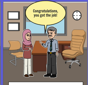
Gratulation, Sie haben den Job!