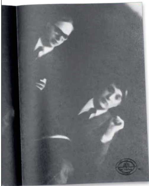
Gilbert & George maakten een aantal bulletins, onder meer in 1974.