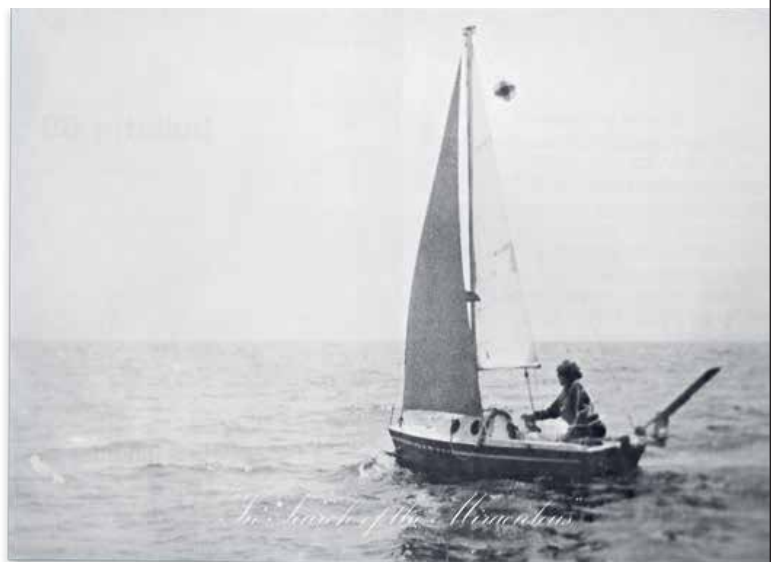
Bas Jan Ader zette op zijn editie uit 1975 een foto van zichzelf in een zeilboot met daarbij de tekst 'In search of the miraculous'.

fd persoonlijk | zaterdag 31 oktober 2015 | 45