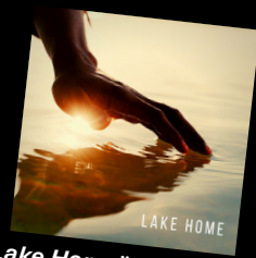
"Lake Home" nytt album