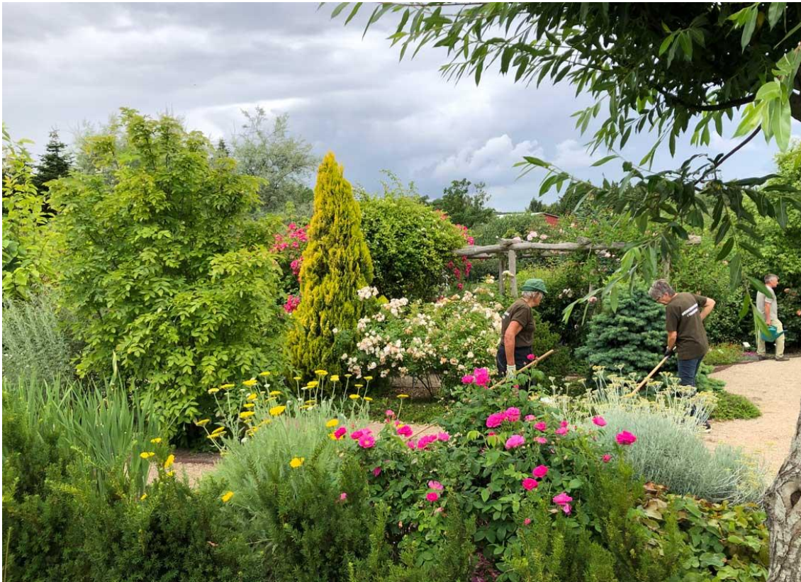
Der luges i Duftafdelingen i Haven for åndedræt og kredsløb.