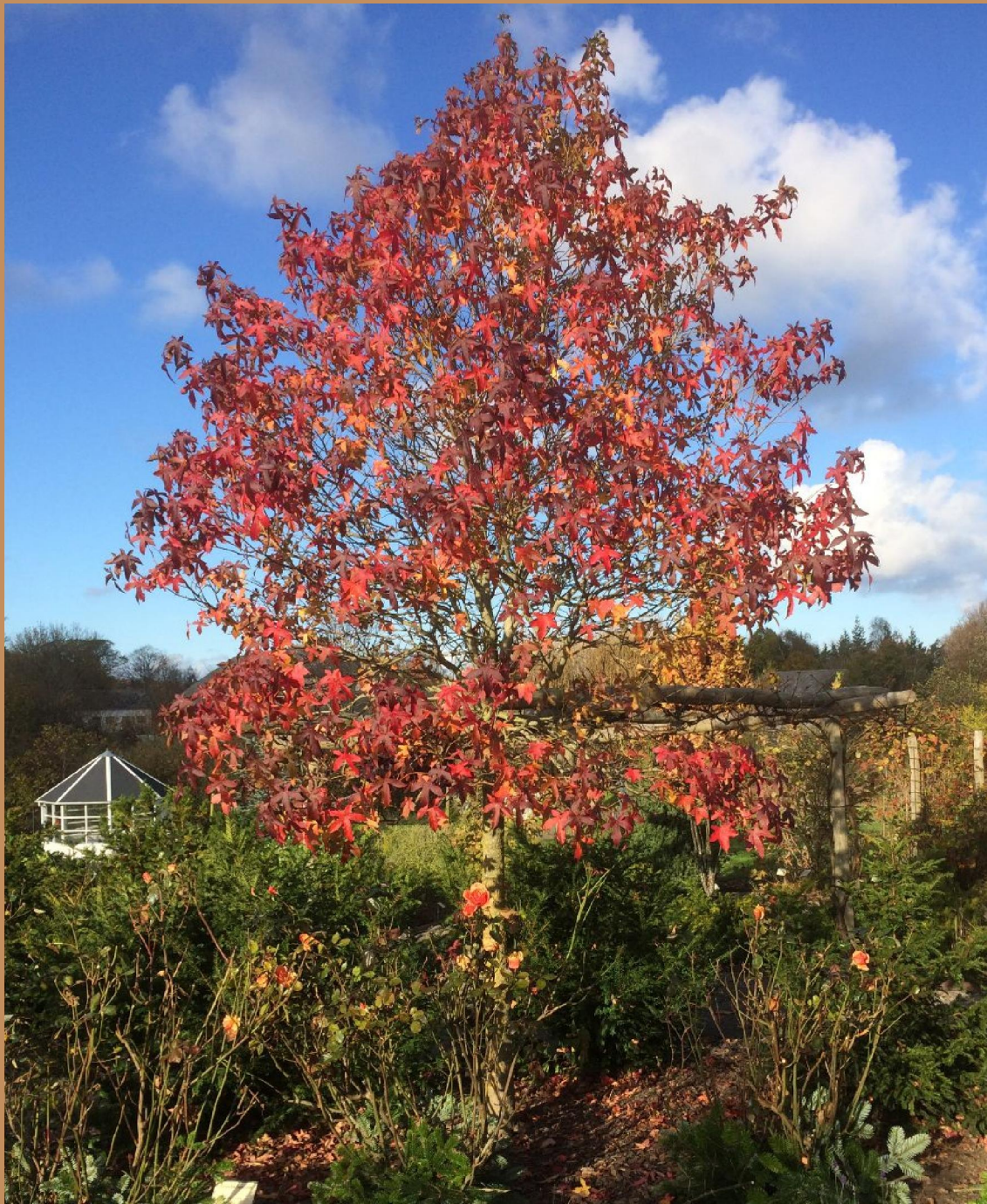
Ambratræet i Haven for åndedræt og kredsløb