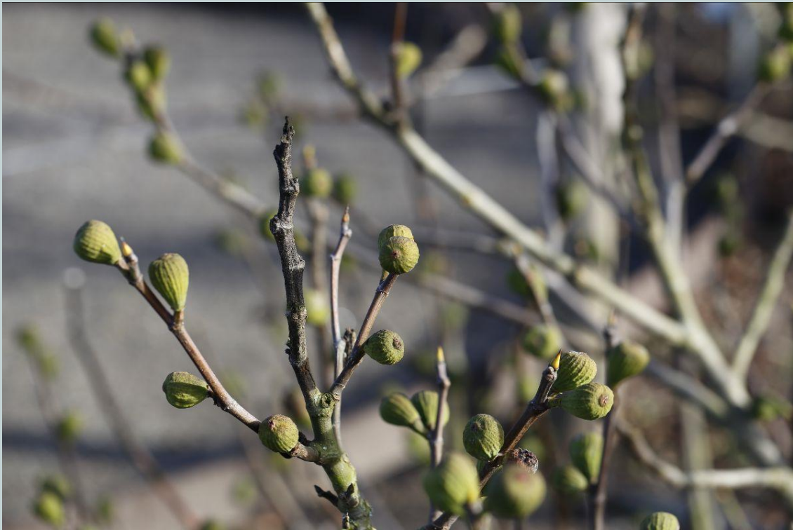
Figner med frugter fotograferet i februar 19 af Søren Hestbæk

Velkommen til Medicinhavernes nyhedsbrev