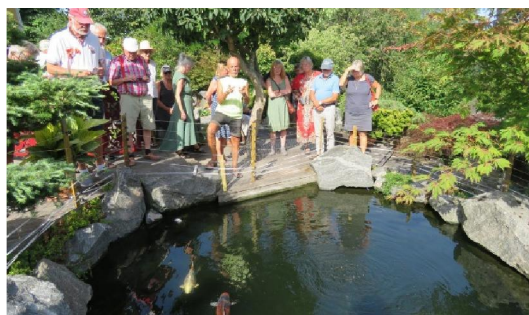
Karpedammen i Den Kreative Have

Turen i år gik den 7. august til Botanisk Have i Aarhus, parken ved Marselisborg Slot og til den privatejede have "Den Kreative Have" i Haldrup ved Horsens.