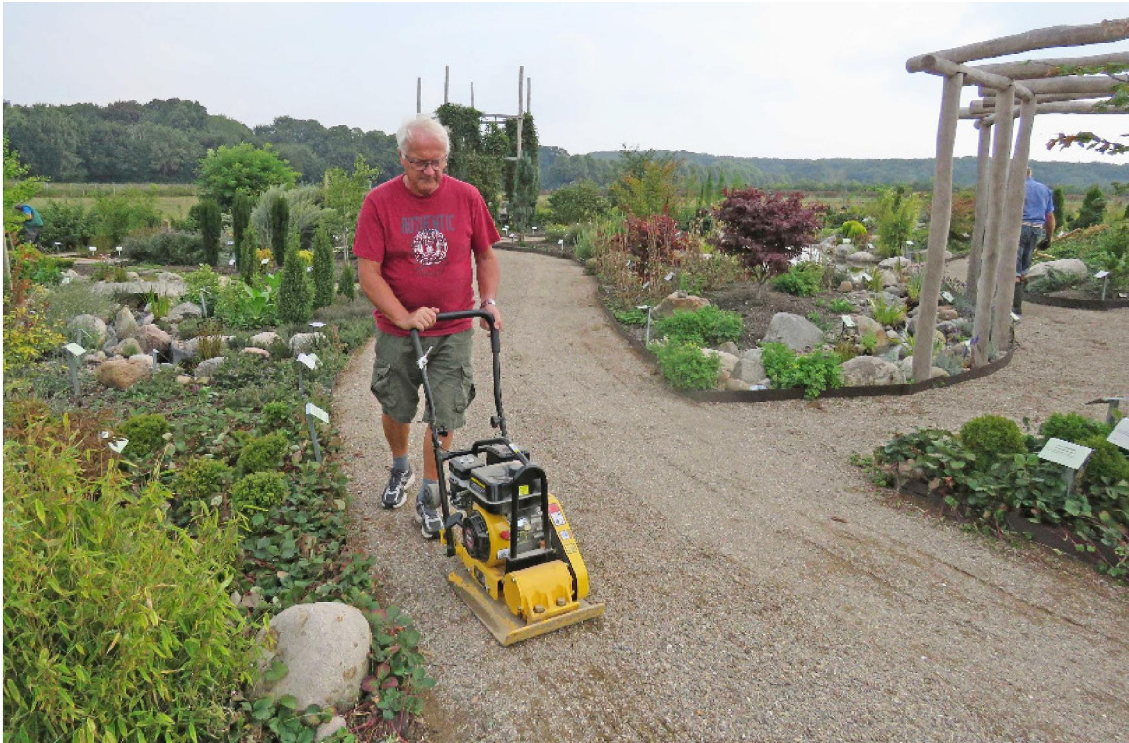
Kaj stamper den nye belægning med slotsgrus i Haven for nervesystem og bevægeapparat