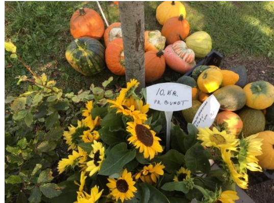
Der er også solsikker og pyntegræskar til salg for tiden