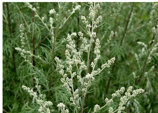
Gråbynke, Artemisia vulgaris

Bynke anvendes kun meget begrænset i dag, og så er det for at fremme fordøjelsen eller hæmme visse bakterier i tarmen. Men lige siden 1200-tallet er bynken blevet omtalt i urtebøger, fordi man mente, den fremmede menstruation, og at den var et middel til at udstøde et dødt foster. Den har også været brugt mod så forskellige lidelser som fordøjelsesbesvær, appetitløshed, leverproblemer, hysteri og vand i knæet, men man kunne også lægge bladene i skoene, for så fik man ikke trætte fødder.