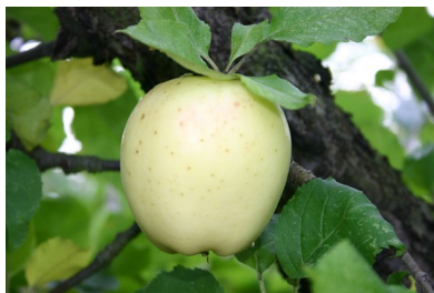
Langelands Hvid Pigeon