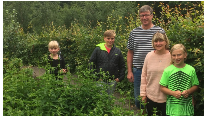
På billedet ses Familien Blak fra Vestjylland, der besøgte Medicinhaverne først i juli, og de var meget imponerede af det, de så.

Kontingentet, der som nævnt gælder for hele husstanden, har været på 150 kr., siden foreningen bag Medicinhaverne blev stiftet 8. april 2008. Bestyrelsen har dog vedtaget, at det fra 2018 stiger til 200 kr. pr. husstand.