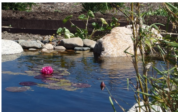
Nu med åkande