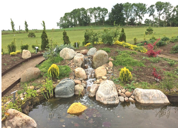
Vandfaldet i Haven for nervesystem og bevægeapparat