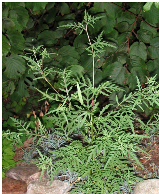
Den invasive bynkeart, Ambrosie Artemisiifolia

Bynke er også en af de planter, som har tilhørt trolddomsmedicin til beskyttelse mod hekseri, men så skulle den være plukket Sct. Hansaften inden klokken 24! Derefter skulle den sættes over alle døre og vinduer for at afværge "trylleri og andet sådant djævelskab". En mere prosaisk brug har været at lægge den under kornet i laden for at holde rotter og mus væk.