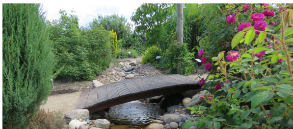
Så smukt er det færdige resultat, her set i Haven for urin- og kønsveje.