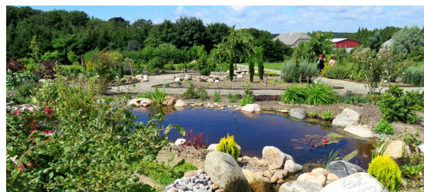
Sådan ser Haven for nervesystem og bevægeapparat ud i dag.