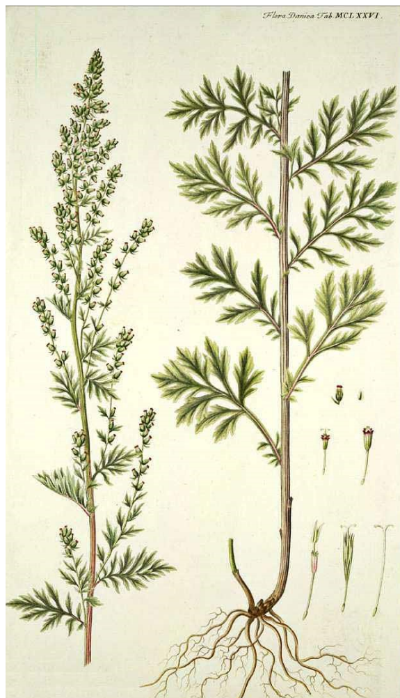
Flora Danicas tegninger af Artemisia vulgaris