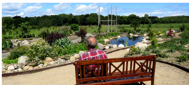
I forsommeren blev der etableret et nyt vandløb i Medicinhaveerne til stor glæde for de mange gæster.

http://wp-medicinhaveerne.prfo.dk/aktivitetsliste/