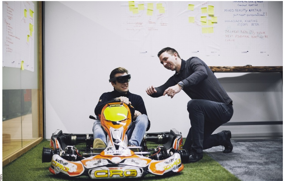
De virtuele bril wordt getest op de karting van Genk en in iSpace, de hoogtechnologische projectruimte van de PXL.

"De meesten leren het vak via karting", gaat Hendrikkx