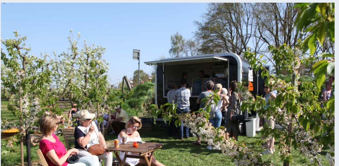
De stad wil met de nieuwe toeristische gids zo veel mogelijk bezoekers naar de streek lokken.

"Zo kan je punten bij krijgen als je een goede rijstijl aanhoudt en punten verliezen als je fouten begaat. Snelheid blijft de belangrijkste uitdaging, maar het heeft toch wel iets extra als je daar een dimensie aan toe kan voegen. Zo zou je de virtuele bril kunnen uitbreiden waarbij je, behalve snelle rondetijden halen, ook moet proberen om iets te vangen."