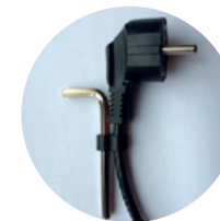
Insexnyckel på sladden