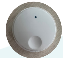
Kvarnen manövreras med fjärrkontroll

Mer information och instruktionsfilmer hittar du på