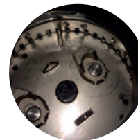
Här fastnar oftast främmande föremål

VIKTIGT: Om kvarnen inte ska användas under längre tid än en vecka så gör rent den ordentligt så att matrester inte riskerar att fastna. Kör kvarnen med vatten tills den är tom och lägg sedan ned en handfull isbitar och starta kvarnen UTAN att använda vatten.