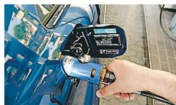
Med miljön i tankarna.

2,5 kilometer kan en biogasbil köra på ett kilo matavfall.