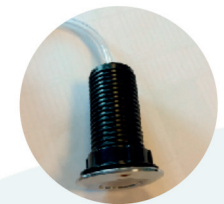
Luftslang ska sitta fast i knappen

Mer information och instruktionsfilmer hittar du på