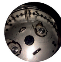
Här fastnar oftast främmande föremål

VIKTIGT: Om kvarnen inte ska användas under längre tid än en vecka så gör rent den ordentligt så att matrester inte riskerar att fastna. Kör kvarnen med vatten tills den är tom och lägg sedan ned en handfull isbitar och starta kvarnen UTAN att använda vatten.