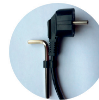
Insexnyckel på sladden