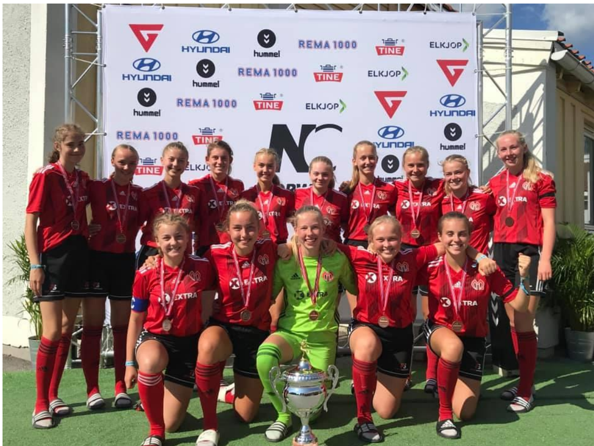
J15/16 vant brosjemedaljer i Norway cup!