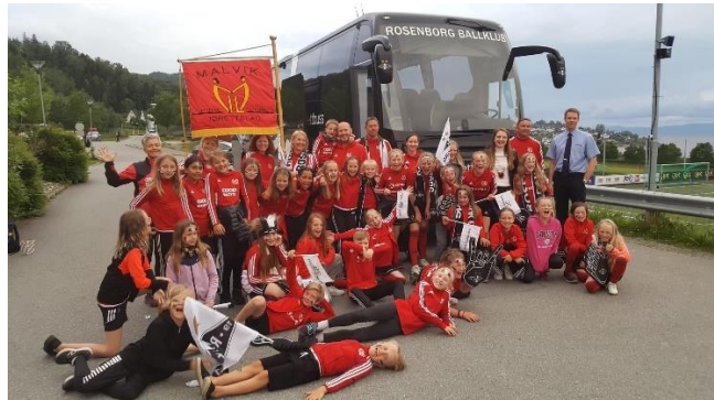
J10/11 med drømmedag etter RBK-besøket på Viksletta!