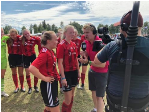
Flere av våre lag hadde TV2 sendte kamper i Norway Cup!