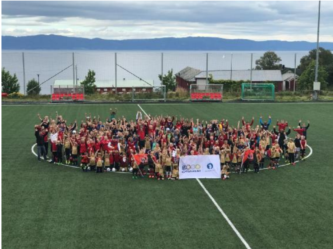
Malvik Fotball – neste mål!