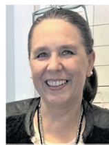
Af Gitte Schwartz, OPLEV

Rudolph Tegn timer gigantiske skulpturer får denne sommer selskab af nutidig billedkunst og lydværk under åben himmel.