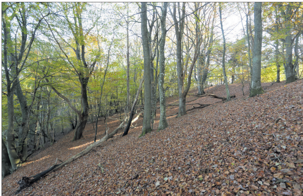
Fugleværnsfonden har købt et stykke af skoven i området Rusland.

Fugleværnsfondens frivillige og naturvejledere er godt i gang med at passe på naturen i naturreservatet og skabe gode rammer for natur- og fugleoplevelser for de besøgende, lyder det i en pressemeddelelse fra Fugleværnsfonden. For eksempel arbejder de frivillige med at optælle fugle, sætte redekasser op og afholde gratis, guidede ture i naturreservatet.