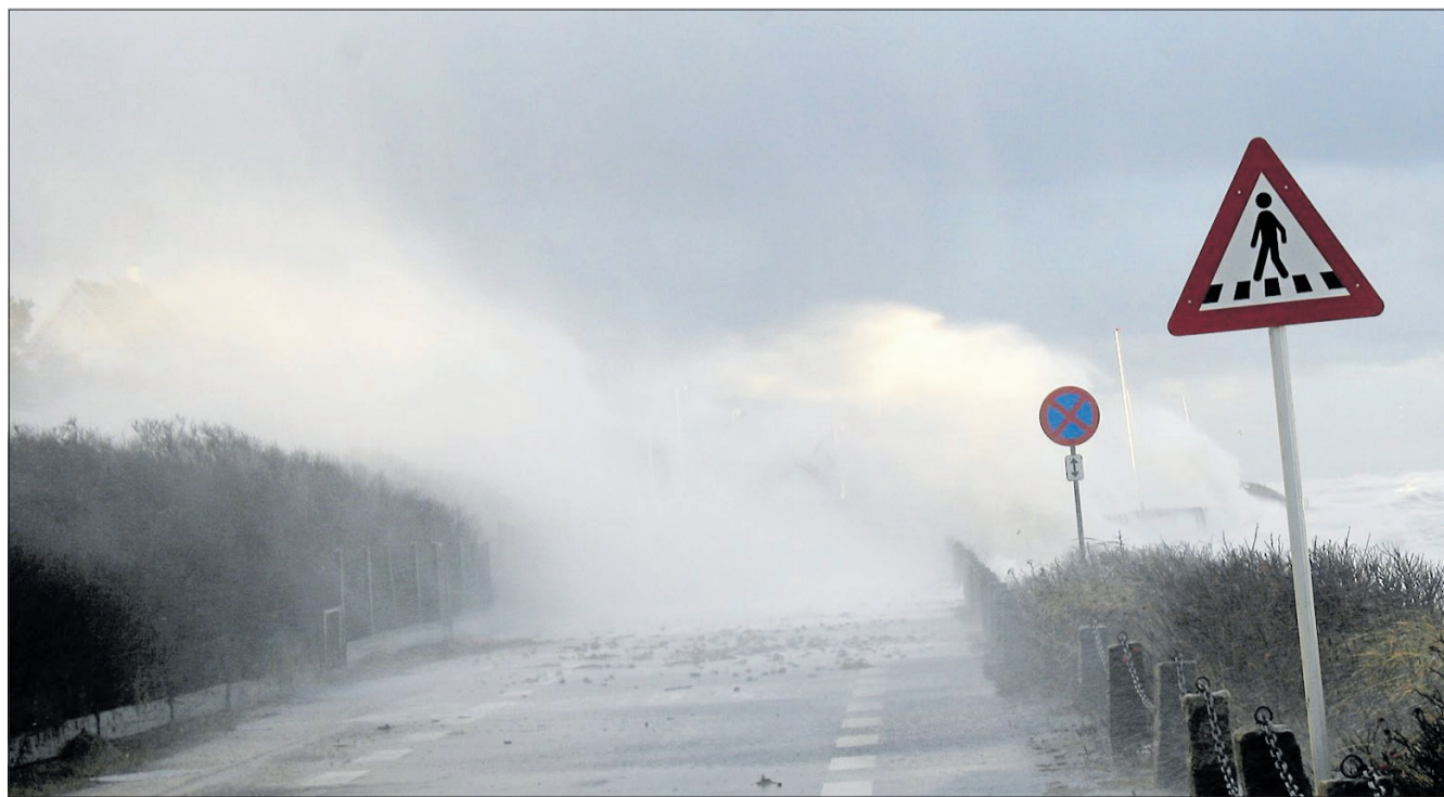
Højvande og storme har de senere år gnavet løs af Nordkysten - især stormen Bodil (her gået i land ved Rågeleje Strandvej) - tog store bidder af kysten og ødelagde for millioner af kroner.

Nordkystens Fremtid fik i 2020 en støtte på 20 millioner kroner fra statens pulje til det fælleskommunale kystsikringsprojekt. I 2021 fik projektet yderligere 21 millioner kroner.