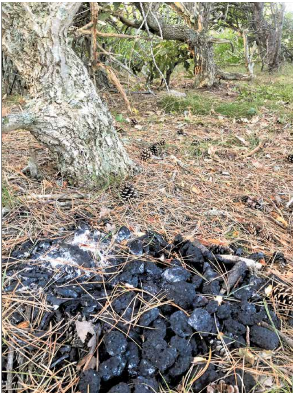
Det er sæson for naturbrande ifølge Gribskov Beredskab, og man skal derfor være forsigtig med, hvor man bruger åben ild i kommunen.

På hjemmesiden brandfare.dk kan man finde gode råd om, hvordan man undgår naturbrande, et brandfareindeks, der viser brandfaren i naturen over de kommende døgn, og en oversigt over, hvor i landet der eventuelt er indført afbrændingsforbud - og hvad forbuddene