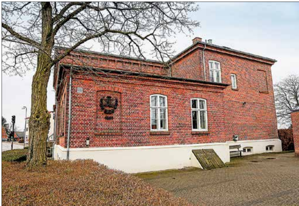
Der er lagt op til, at nærpolitiet vil få til huse i tinghuset i Helsingør.