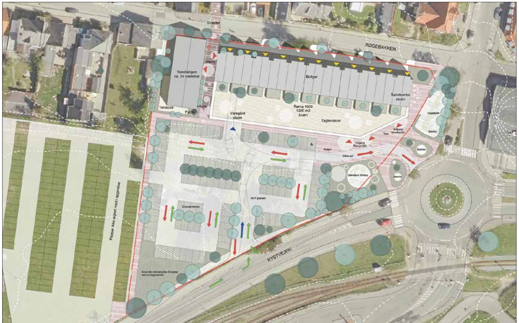
Det nye udspil fra supermarkedskæden Rema 1000 opererer med et vandrerhjem nærmest Gilleleje Hallen og et turistkontor tæt på Gilleleje Stationsvej.