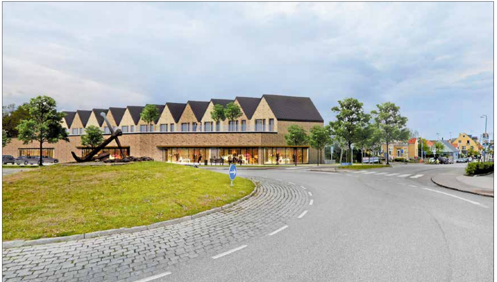
Supermarkeds kæden Rema 1000 ønsker at opføre en helt ny og større butik ved rundkørslen i Gilleleje. Oven på butikken bliver der beboelse – og det bliver muligt at gå langs Møllegade til handsgaden Vesterbrogade.