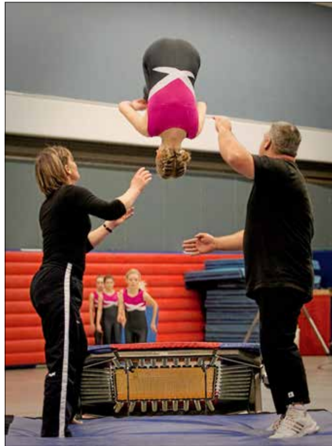
Et år uden de store gymnastikstævner. Det sætter præg på årets aktiviteter, men medlemsflugt er der ikke tale om.