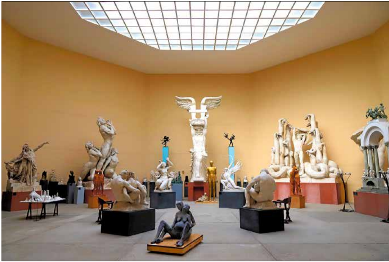
Rudolph Tegnerts Museum og Statuepark har haft et rekordår med knap 100.000 besøgende i alt.