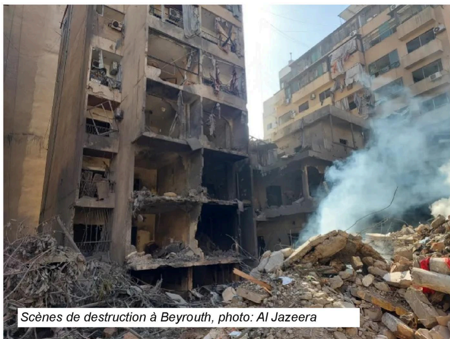
Scènes de destruction à Beyrouth

Le vote de cette loi d'apartheid revient, entre autres, à légitimer les attaques meurtrières, toujours plus nombreuses et violentes, commises par les colons d'extrême droite israéliens en Cis-