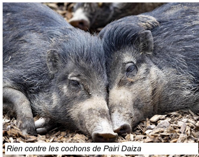
Rien contre les cochons de Pairi Daiza