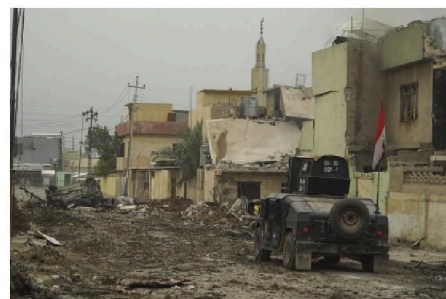
Les destructions suite au bombardement de Mossoul en 2017, auquel l'armée belge a participé

En réalité, c'est nos pays capitalistes qui « exportent » la guerre au Moyen-Orient depuis plus d'un siècle. Chaque génération assiste à des guerres destructrices : Irak (1991, 2003-2011), Afghanistan (2001 - 2021), Libye (2011-2020), Syrie (2011 - 2025).