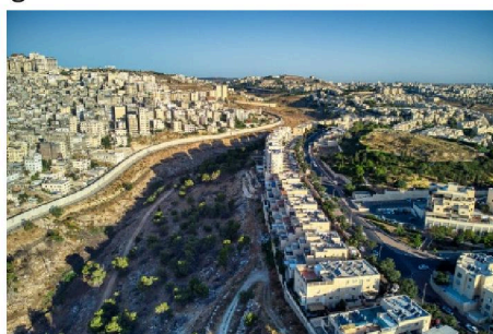
Colonie israélienne face à un camp de réfugiés palestiniens en Cisjordanie

Depuis des mois, des dizaines de milliers de Palestiniens de Cisjordanie ont été expulsés de leur maison et de leur terre et plus d'un millier ont été tués. Et maintenant que le monde a les yeux tournés vers l'Iran, les attaques de colons contre les Palestiniens se multiplient. Netanyahu et son gouvernement d'extrême droite