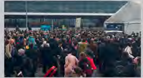
Voyageurs pris en otage par la course aux profits

Les avions décollent grâce à toute une armée de travailleurs. Ils ont raison de vouloir être payés correctement !