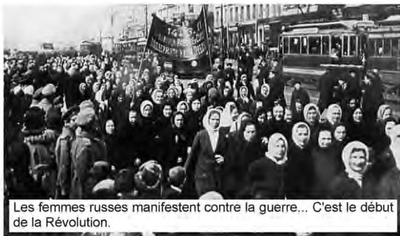
Les femmes russes manifestent contre la guerre... C'est le début de la Révolution.