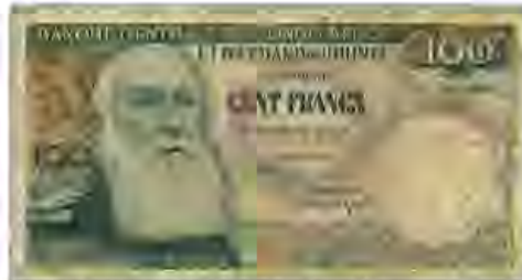
Léopold II de triste mémoire... sur un billet de « son » Congo.

bestialité sur lesquelles s'appuyait la domination des puissances impérialistes bien avant qu'elle n'éclate sur les champs de bataille européens. Ils la vécurent dans leur chair.