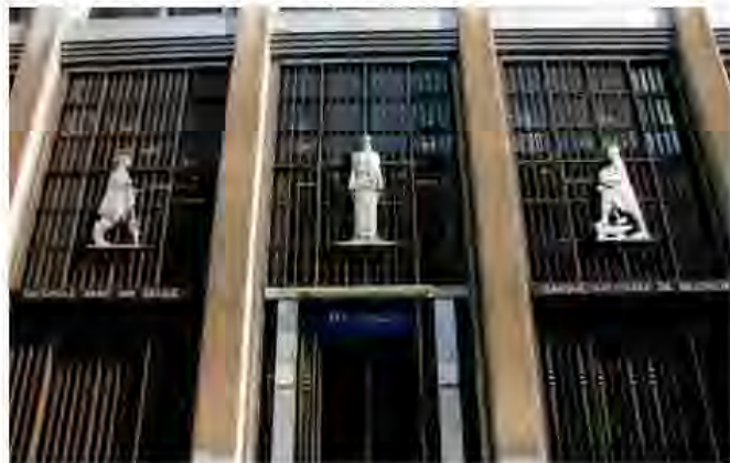
La Banque nationale de Belgique, comme toutes les banques: au service des patrons.