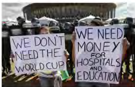
Les manifestants réclament de l'argent pour les hôpitaux et les écoles.

Extrait du journal Lutte Ouvrière (France) du 20 juin.