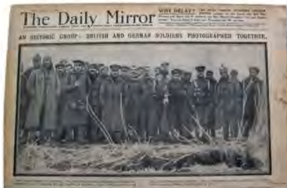
Fraternisation de décembre 1914 : des soldats anglais et allemands se prennent en photo ensemble.

Ce sont bien les rivalités engendrées par le système capitaliste qui ont entraîné cette première boucherie mondiale. Tout comme aujourd'hui l'impérialisme continue d'engendrer une multitude de conflits pour maintenir par la force un ordre mondial injuste. Seul le renversement de ce système mettra la société à l'abri du danger de sombrer une fois encore dans un conflit similaire à ceux qui ont ensanglanté le 20e siècle.