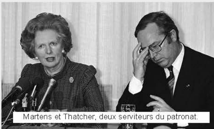
Martens et Thatcher, deux serviteurs du patronat.

Il vaudrait mieux se débarrasser de ces politiciens ! De Wever et ses semblables dans les gouvernements n'ont aucune utilité, contrairement aux employés communaux. Et il faudrait imposer que les banques, les grandes entreprises et les riches prennent sur leurs fortunes pour payer les salaires et les pensions des employés communaux.