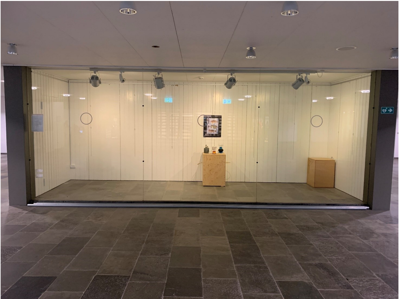
Kunstrammen i bygning 306 er lige nu tom og kunstforening har ingen planer for udstilling i 2024