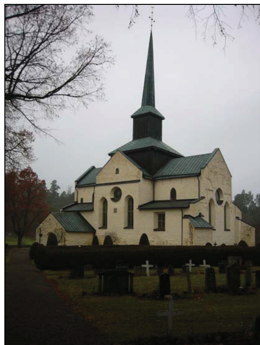
Skällviks kyrka 1943 och 2007.