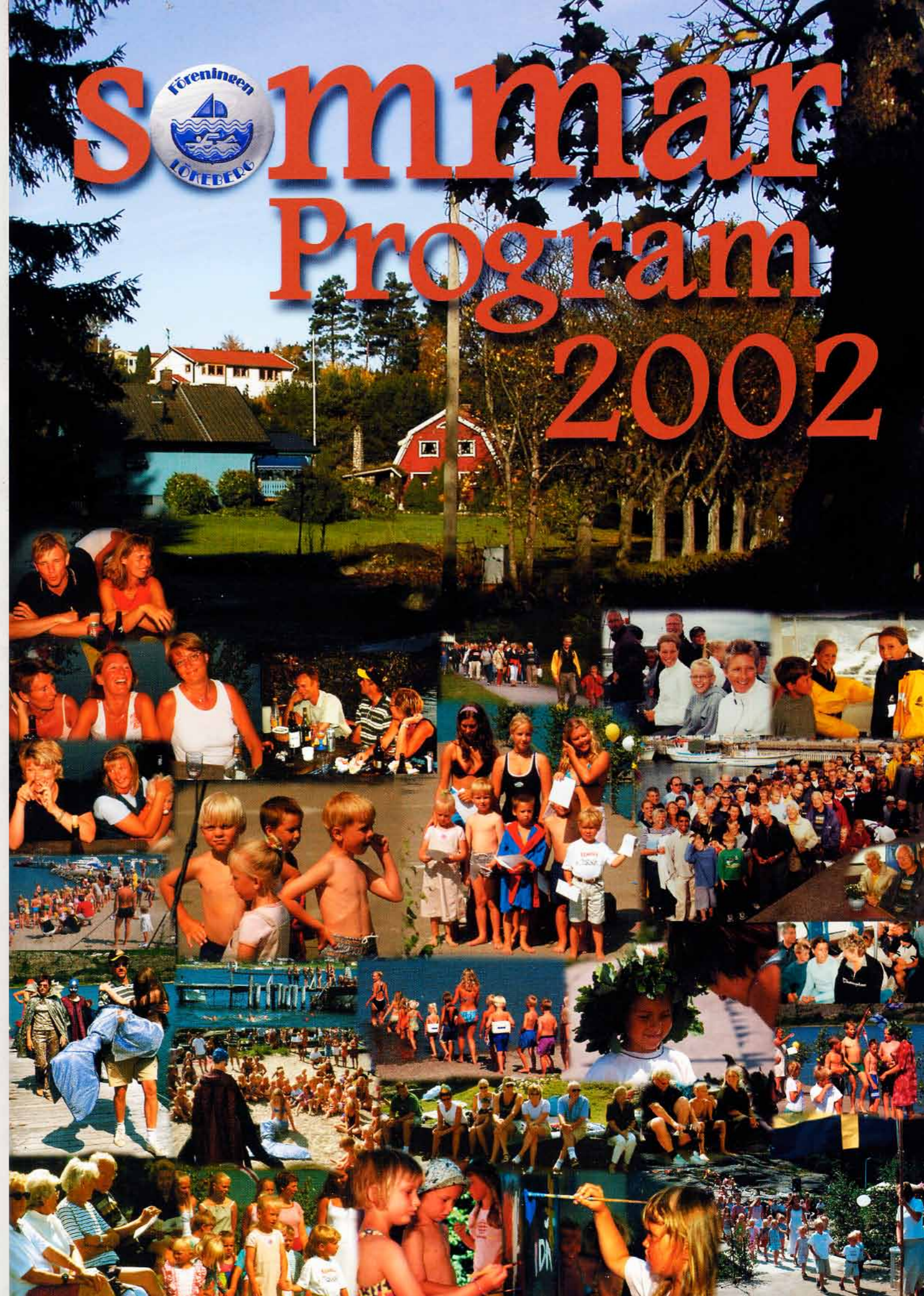
Foto och Grafisk produktion: Kent Isaksson Lökeberg2002 Trycket sponsras av Convenio och Geson

Samlad kompetens, erfarenhet och kreativitet med tekniska lösningar inom ljud, ljus, bild och IT