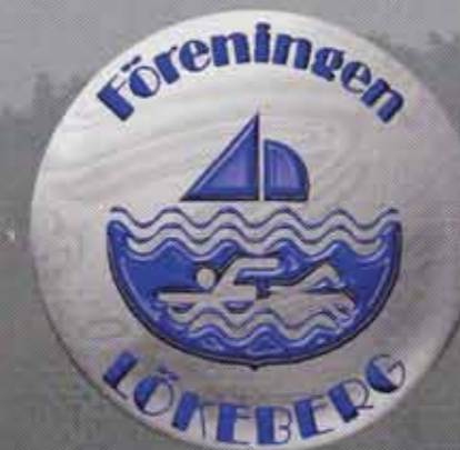
Foto och Grafisk produktion. Kent Isaksson Göteborg 2001 Trycket sponsras av Geson & Convenio

Borgås gårdsväg 1, Box 10323 434 24 KUNGSBACKA Tel. 0300-77 000, Fax 0300-714 03 E-post: geson@geson.se www.geson.se