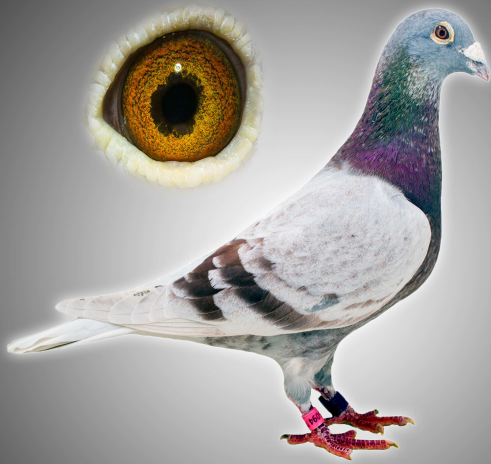
Bel 08-6205094 "Aristocraat"