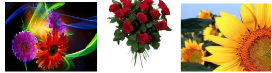
Gerbera Rosenbukett Solros