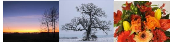
Sol Ek Rosor

Dessa 3 motiv finns att välja vid utfärdande av gratulationskort.