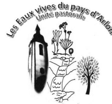
Notre Dame du Bel-Amour