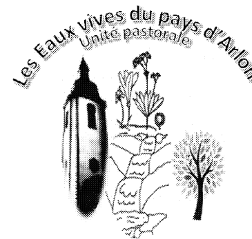
Notre Dame du Bel-Amour