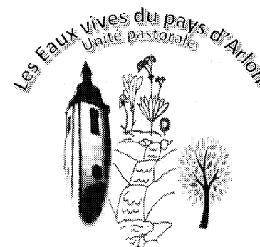
Notre Dame du Bel-Amour