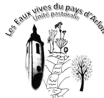
Notre Dame du Bel-Amour