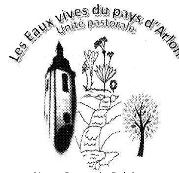
Notre Dame du Bel-Amour