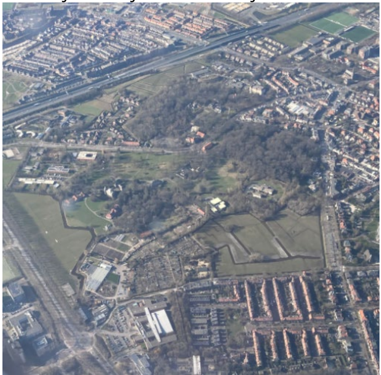
Endegeest vanuit de lucht met rechts onderin de Vogelwijk

Strandwallen zijn langgerekte, uit zand gevormde verhogingen in het landschap van de kuststreek. Ze bestaan uit zand dat is aangevoerd door de zee en lopen min of meer evenwijdig aan de kustlijn. Ze zijn maximaal vijfhonderd meter breed en tien meter hoog en worden onderbroken door geulen en rivieren als de Oude Rijn. Omdat onze wijk op het zand van zo'n strandwal is gebouwd, zijn veel huizen niet onderheid omdat dit niet nodig is. Tussen de strandwallen liggen op veengronden graslanden en elzen- en essenhakhoutbossen. Veel van de strandwallen zijn in de laatste eeuwen afgegraven voor de winning van bouwzand.