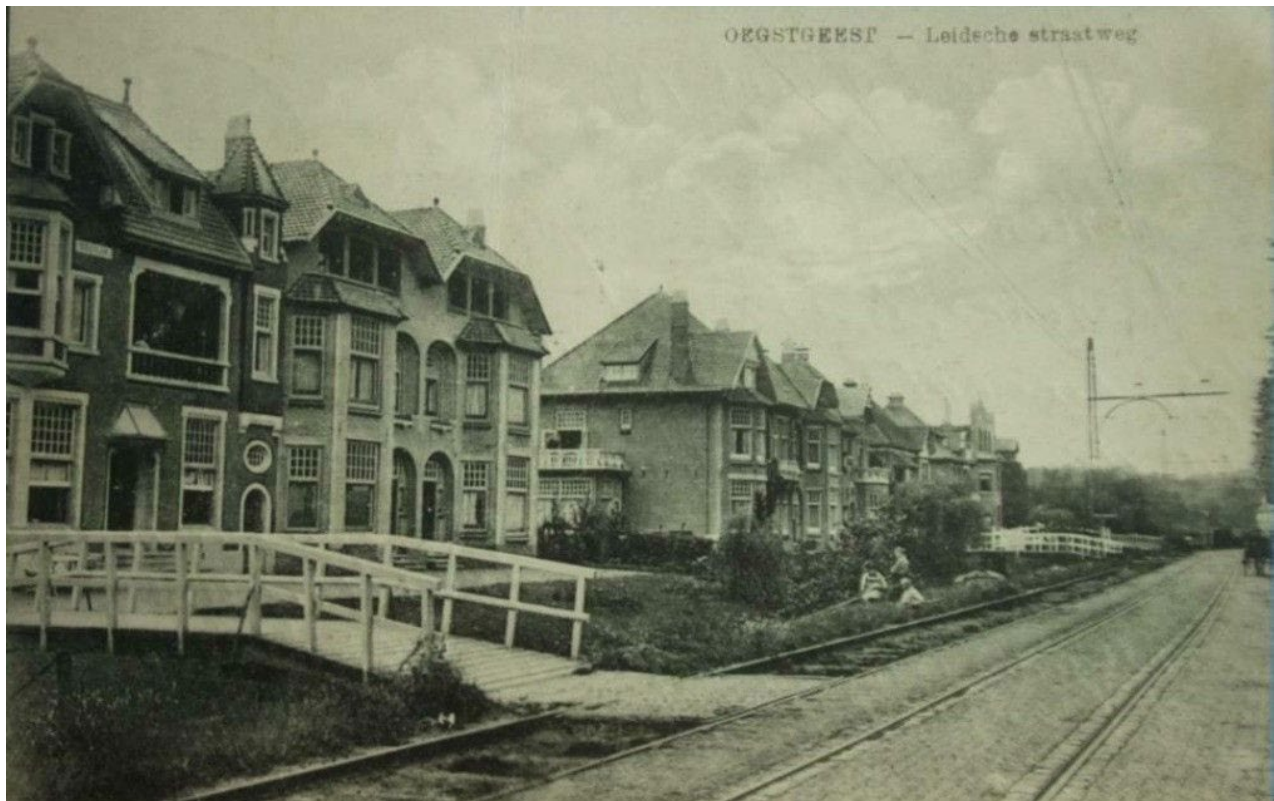
Toen de Vogelwijk nog moest worden getekend