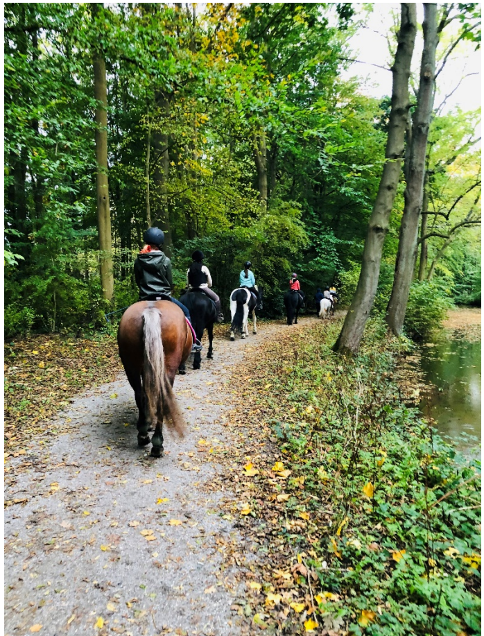
FPaardrijden in het Bos van Bosman