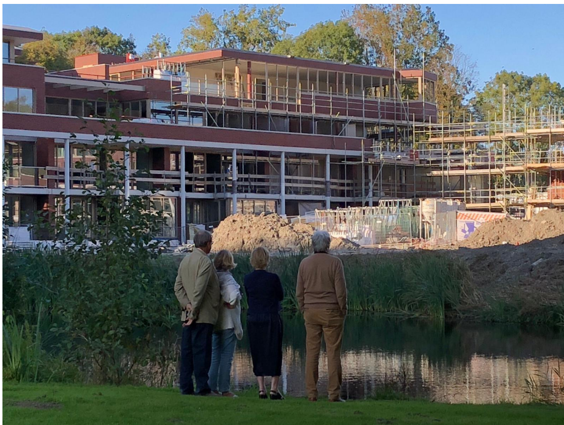
De nieuwe Wijkbewoners arriveren