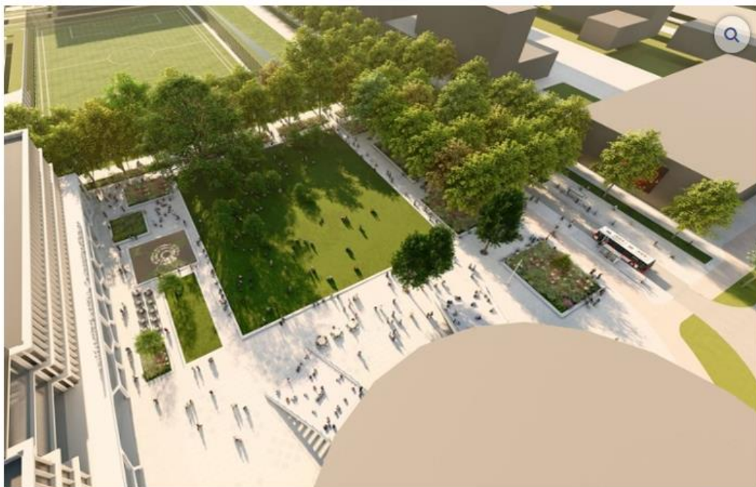
Impressie van het Campusplein, straks geschikt voor tal van activiteiten. © West 8

De Universiteit Leiden wil het Campusplein, het hart van het Bio Science park, inrichten met een groene ontmoetingsplek met een vijver en zitjes, en een grote ligweide. Een festival programmeren op het Campusplein, een openluchtbioscoop of een yogaclinic – dat behoort straks allemaal tot de mogelijkheden. Dit plein zal vooral veel worden gebruikt als ontmoetingsplek van studenten en medewerkers van de Science Campus (de faculteit Wiskunde en Natuurwetenschappen), waar zij kunnen werken en studeren. Maar uiteraard zijn ook inwoners van de stad hier welkom zoals omwonenden, cultuurliefhebbers en sportliefhebbers.