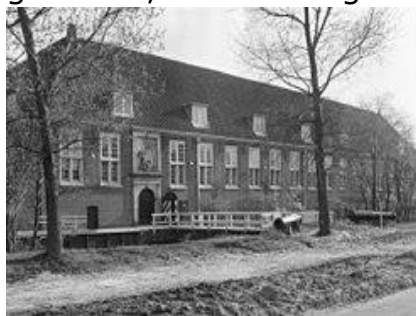
Pesthuis aan de Pesthuislaan (Wikipedia)

Ze kregen van de stedelijke overheid een vergoeding voor deze verzorging van de onreinen, en ook een aparte vergoeding voor elke begrafenis, maar ze kregen geen vergoeding voor hun tijd en moeite als ziekentrooster. De Minnebroeders werkten goed samen met een ander groot klooster, ook net buiten de stadsmuren gelegen: het Hiëronymusdal, ook wel het Lobsenklooster genoemd. De gemeente kocht het Hiëronymusdal in 1526 en koppelde het aan het Catharinagasthuis als een soort buitenziekenhuis , speciaal bestemd voor de verzorging van de onreinen. Ook met het Catharinagasthuis werkten de Minnebroeders goed samen. In aanloop naar het Spaans beleg van 1573/1574 werden de gebouwen van het voormalige Hiëronymusdal met de grond gelijk gemaakt, zodat het geen voordeel voor de Spanjaarden zou kunnen zijn. Na